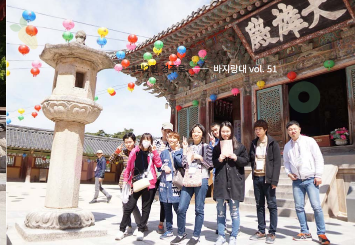
바지랑대 vol. 51