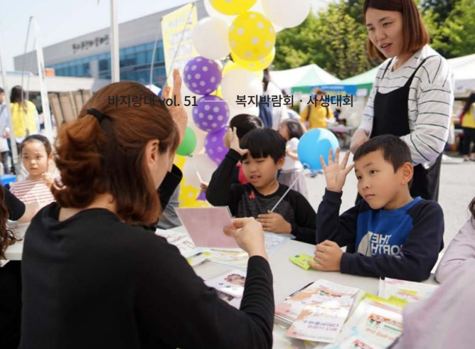
바지랑대 vol. 51 — 복지박람회 · 사생대회