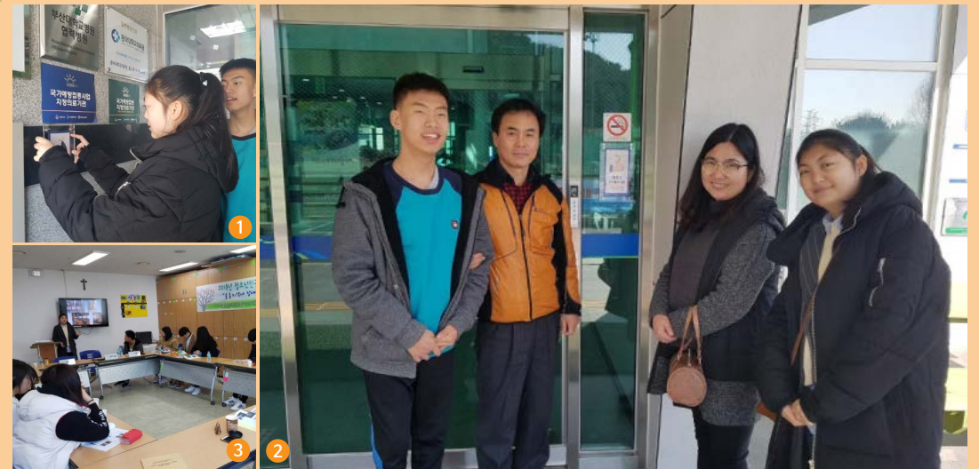
1·2 우수편의시설에 현판을 부착하고있는 청소년인권서포터즈

현판식과 조사한 자료를 토대로 토론회를 개최하여 청소년인권서포터즈들의 활동을 칭찬하고 지지하며 현재 응동지역 편의시설에 대해 허심탄회하게 얘기하는 시간을 가졌습니다. 비록 지금은 미약하지만 모든 가게가 우수편의시설이 될 수 있도록 더 열심히 알리고 활동하는 청소년인권서포터즈들이 되기로 다짐하며 의지를 다질 수 있는 유익한 시간이었습니다.